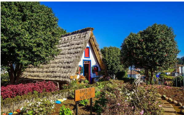
Bauernhäuschen in Santana