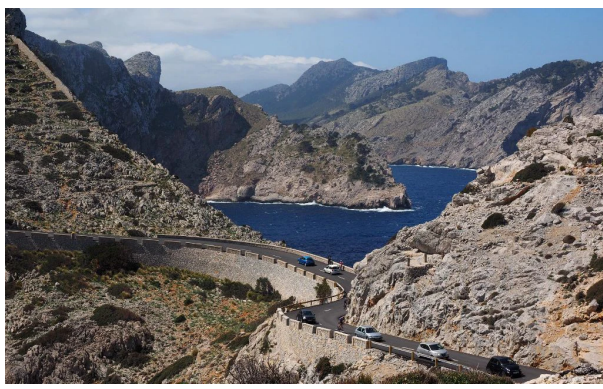
Serra de Tramuntana